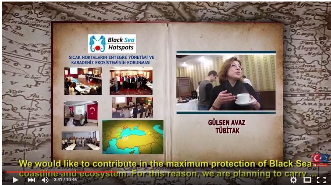
CBC Programme Introduction Movie

( https://www.youtube.com/watch?v=GAnwEutuV6A&feature=player_embedded )