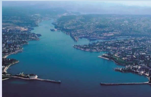
Севастопольська бухта на протязі багатьох десятиріч зазнає значного антропогенного тиску